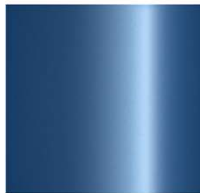
734 - FJORD BLUE