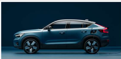
SÉRIE: TETO NA COR PRETO

Fotos meramente ilustrativas. As cores aqui apresentadas são uma representação aproximada da realidade e podem sofrer variações.