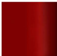
725 - FUSION RED