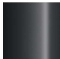
728 - THUNDER GREY