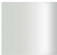
707 - CRYSTAL WHITE